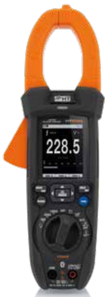
DISPLAY A COLORI