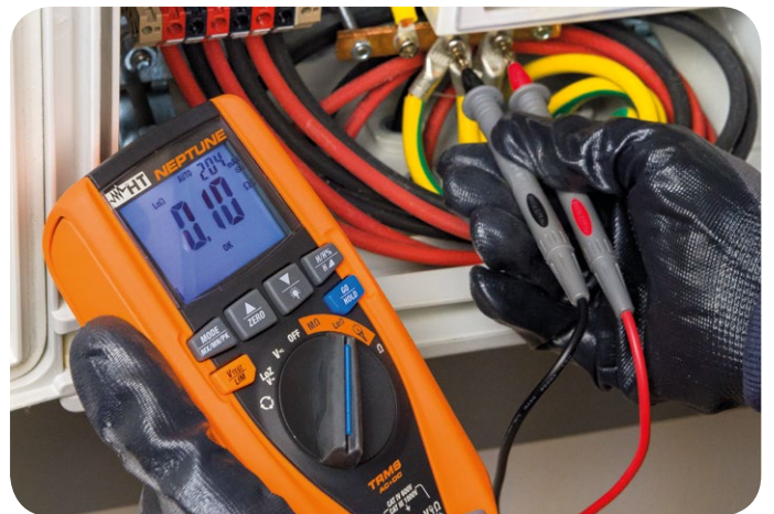
Continuità dei conduttori di protezione.