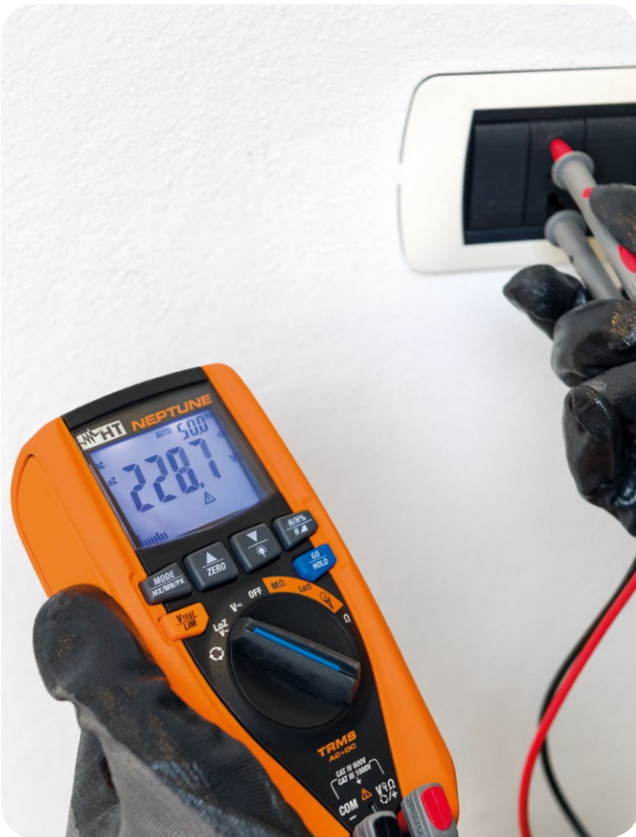
Azzeramento Tensione parassita .