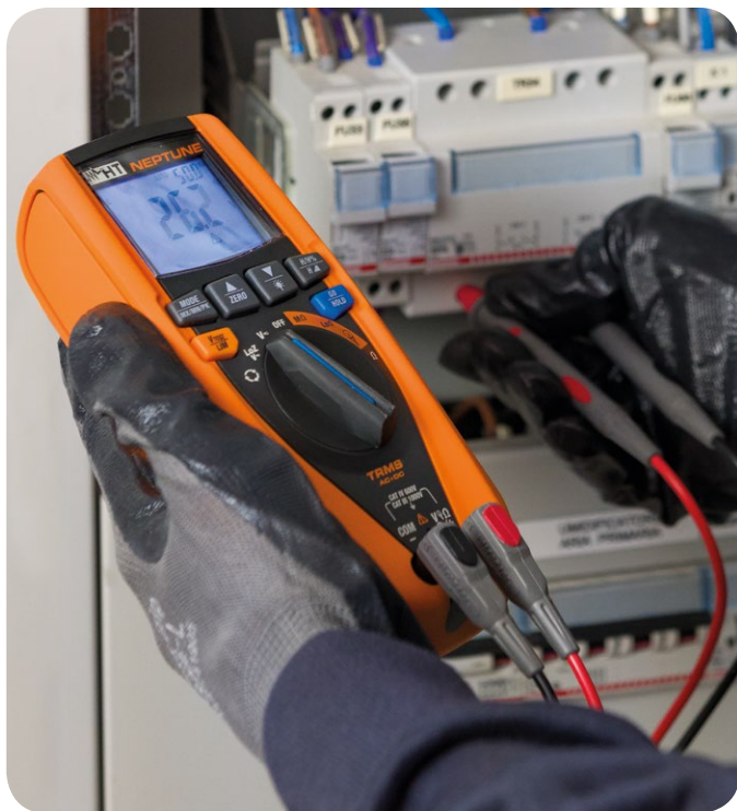
Misura di tensione con puntali di misura.