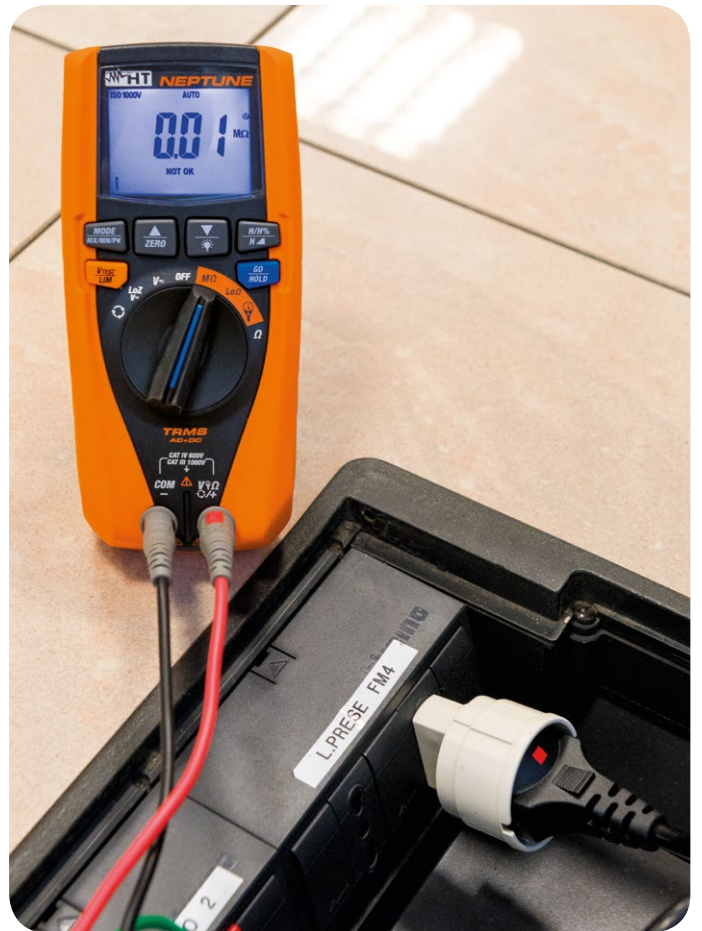
Misura Resistenza di Isolamento (Adattatore Schuko C2065 opzionale).