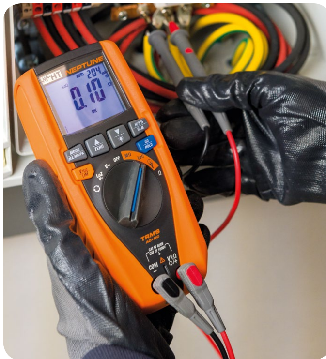
Continuità dei conduttori di protezione con 200mA.