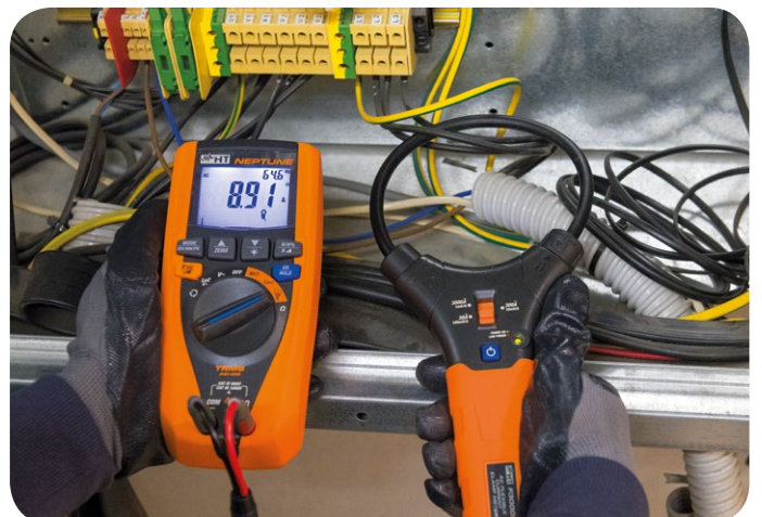
Misura di corrente tramite trasduttore flessibile F3000U.