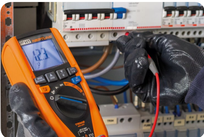
Misura del senso ciclico delle fasi con un puntale.